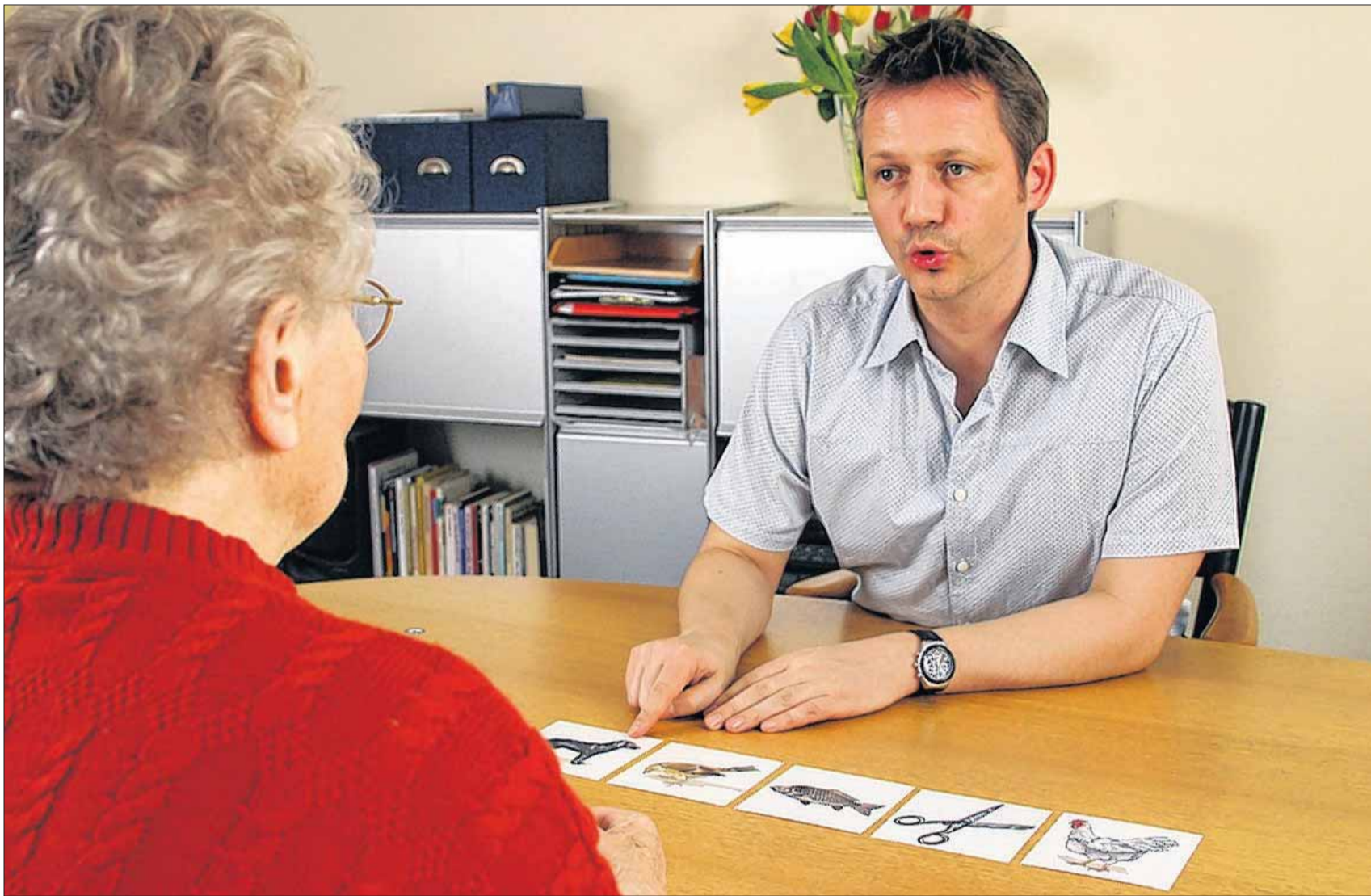
Logopäden behandeln Menschen jeden Alters.